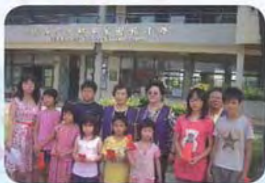
101.5.23 芳苑國小發放獎助學金