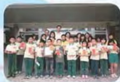
101.5.18 國姓國小發放獎助學金