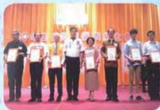
101.4.22 捐血中心績優團體表揚