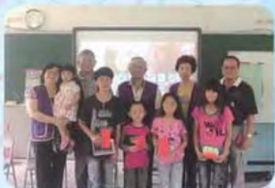
101.5.29 神木國小發放獎助學金