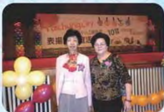
101.12.1 績優志工表揚 - 東海大學 -2