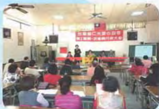
101.12.22 第 13 屆會員代表大會 -2