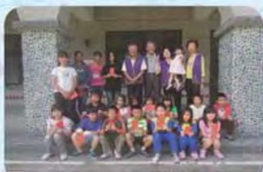
101.5.29 同富國小發放獎助學金