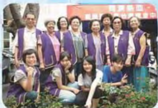
101.7.14 中正公園捐血宣導-2