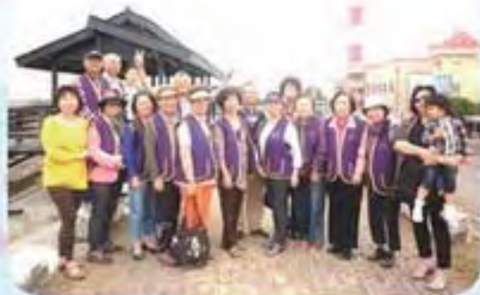
101.11.21 自強活動 - 高美溼地