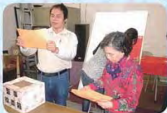
101.12.22 第 13 屆理監事選舉