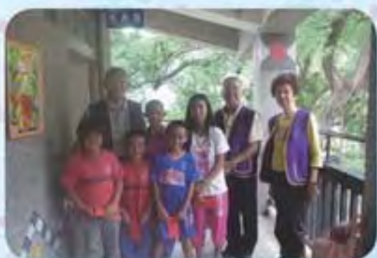
101.5.29 人和國小發放獎助學金