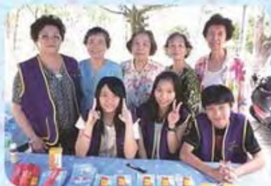
101.7.14 中正公園捐血宣導-1