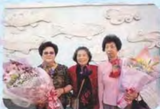
101.12.1 績優志工表揚 -1