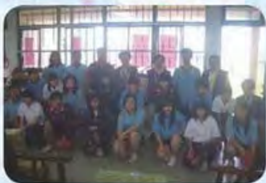
101.5.23 大城國中發放獎助學金