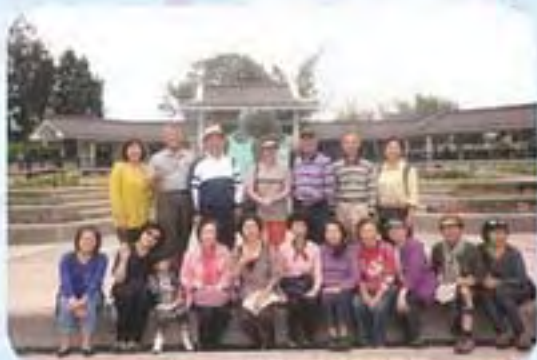
101.11.21 自強活動 - 台中港區藝術中心